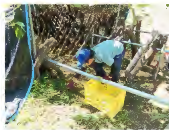
「ほだ場の管理」(除草作業他)