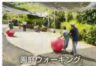
園庭ウォーキング