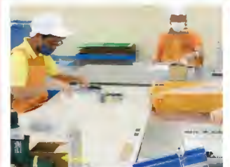
自動車部品組み立て