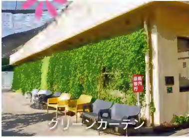
グリーンカーテン